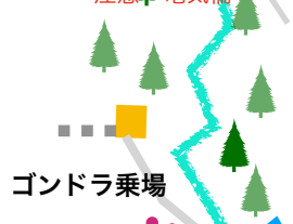
富士見高原が一望 眺望抜群!!!