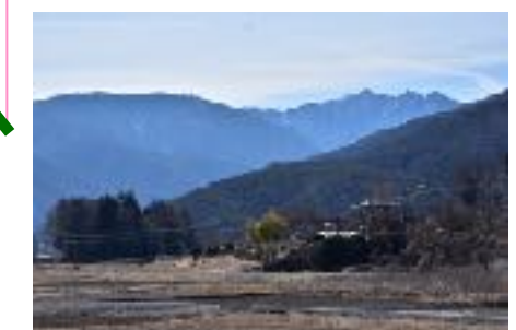
鋸岳、雨乞岳と若宮から木の間にかけた風景。