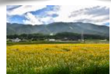
保育園児と小学生が種を蒔いたヒマワリ畑