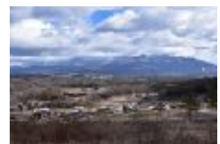
栗生コースからの大展望