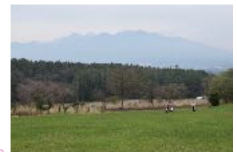
草原コースの草原。子供達が遊んでいる。