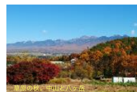
草原の秋。中山と八ヶ岳

2022.5.3改定